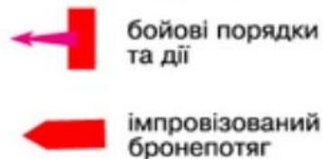
Схема бою виконана сотником С.Горячк ом