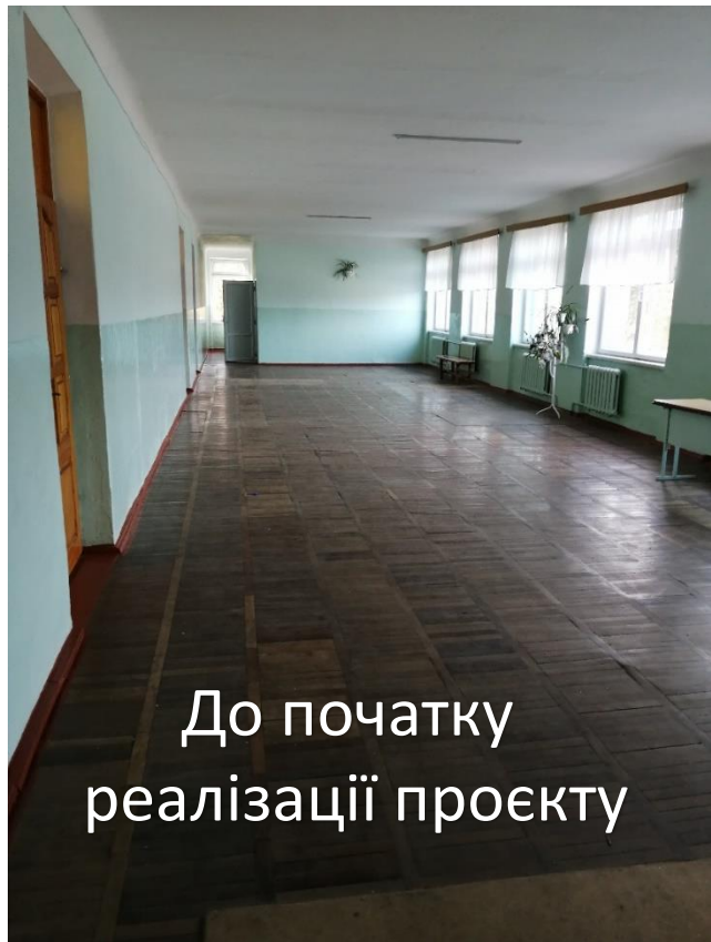
До початку реалізації проекту