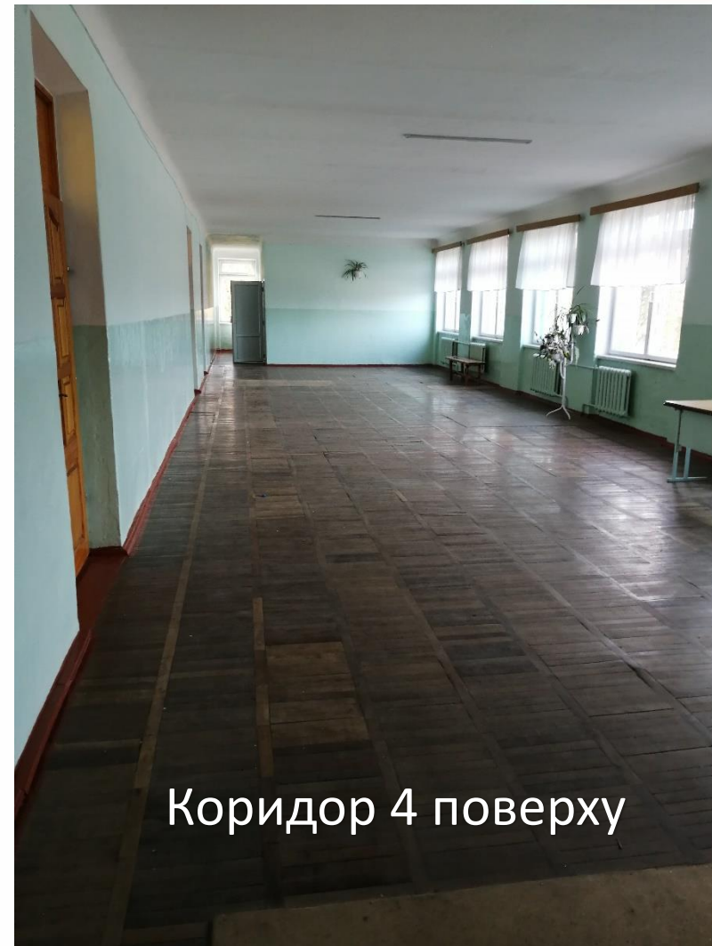
Коридор 4 поверху

Осучаснення шкільної рекреації 4 поверху, створення комфортних затишних умов для релаксації учнів 5-11 класів