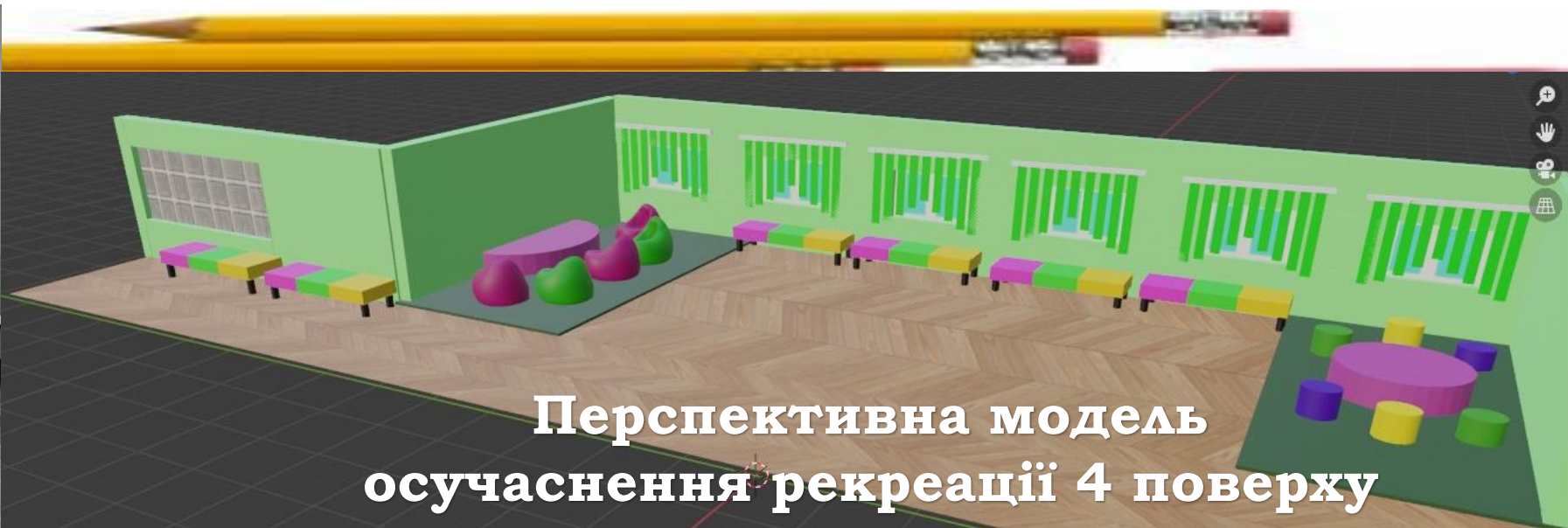
Перспективна модель осучаснення рекреації 4 поверху